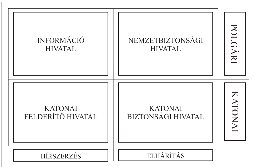
2. ábra. A magyar nemzetbiztonsági (titkosszolgálati) struktúra 12

szolgálat állami fegyveres szerv, ahol a vezetés alapvető eszköze a parancs, a munkatársak szigorú függelmi rendben látják el szolgálatukat. A magyar hírszerző szolgálatok által alkalmazott erők, eszközök, módszerek tekintetében nincs lényegi különbség, az információszerzés minden formáját megtalálhatjuk a szakmai tevékenység széles repertoárjában. A KFH tevékenységének fő erőkifejtését a biztonságpolitika katonai elemeire, a katonapolitikára, a hadiiparra és a katonai információkra összpontosítja, míg az Információs Hivatal a biztonság összes többi szegmensével foglalkozik.