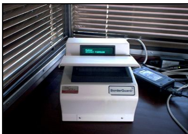
2.sz. ábra BorderGuard

Határátlépéseit rögzítő rendszer létrehozása szintén egy stratégia cél. A létező, országonként különböző rendszereket kellene összehangolni vagy egy közös újat létrehozni. A határregisztrációs rendszer célja az, hogy a tagállamok illetékes hatóságai az ellenőrzött harmadik országbeli személy tartózkodásának jogszerűségét meg tudják állapítani. Egyrészt, hogy a külföldi az arra kijelölt helyen és időben lépte át a külső határt, másrészt az engedélyezett tartózkodási idejét nem lépte túl. A rendszerbe történő ellenőrzés lehetősége nemcsak a külső határokon szolgálatot teljesítő hivatalnokoknak, hanem a terület mélységében végrehajtott idegenrendészeti ellenőrzést véghezvivő tisztviselőknek engedélyezett lesz. A rendszer figyelmeztetést küldene a nemzeti hatóságok számára, amikor lejár egy egyén engedélyezett tartózkodási ideje az EU-ban, és nem rögzítették kilépési adatait. 2011-ben várható a jogalkotás 28 a határregisztrációs rendszerre vonatkozóan, mely megalapozná annak fejlesztési lehetőségeit.