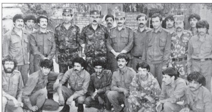
4. ábra. Állambiztonsági operatív csoport, 1989 május

Áprilistól a kormányerők vették át a kezdeményezést, és kiszorították a támadókat Dzsalálábád elővárosaiból. Mindez erősítette a rezsim kitartását, és demoralizálta a támadókat. Május közepére a kormányerők megtörték az ostromot. Május végétől a kormányerők kezén ismét működött a repülőtér, a logisztikai támogatás szállító helikoptereken is be tudott jutni. Július elején visszafoglalták a külső védelmi vonal összes pontját, és megerősítették pozícióikat a városban és környékén is.