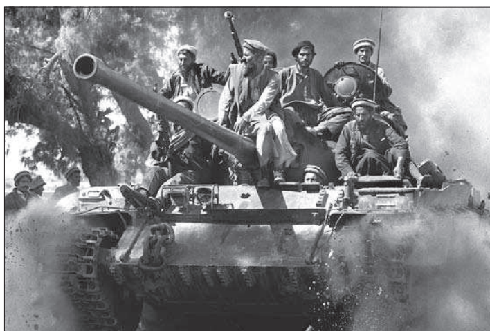
3. ábra. Mudzsáhidok zsákmányolt tankon

A kormányerők intenzív légi támogatással rendelkeztek. Az afgán légierő MIG-21-es ME és MX vadász és bombázó gépeket, SU-7 és SU-22 bombázókat, valamint MI-8-as és MI-17-es harci helikoptereket vetett be, amelyek a mazári, bagrami és a kabuli légi bázisokról szálltak fel. AN-12 szállítógépeket is átalakítottak bombázóvá. Az afgán légierő gépei napi száz-százhusz bevetésben bombázták, harci helikopterei lőtték a mudzsáhidok állásait, jelentős veszteséget okozva nekik. Intenzíven alkalmaztak fürtös bombákat, támadó gépekké átalakított MI-12-es helikopterekkel több bevetést is végrehajtván az ostromló erők ellen. A harci gépek nagy magasságból, a támadó helikopterek ellenben alacsonyan, szinte a fák felett, mudzsáhidok által kilőtt Stinger-rakéták hatótávolságán kívül bombázták – kazettás (fürtös) bombákkal is – Hekmatjár és Szajjáf erőit.