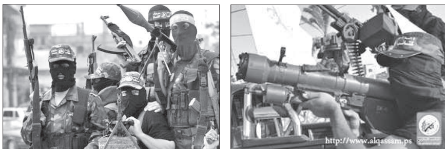
1. kép. Hamász fegyveresek

A Hamász katonai képességeinek növekedésében szerepet játszott a líbiai fegyverraktárakból ellenőrizetlenül kikerülő hatalmas mennyiségű fegyver is. A Hamász alapvető fegyverzetét, elsősorban a terroristák között nagy népszerűségnek örvendő kézfegyverek képezik, amelyek mellett megjelentek kézi légvédelmi rakéták, légvédelmi géppuskák és, a saját gyártású rakéták (1. kép).