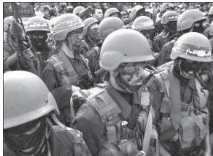
3. kép. Aramidból készült katonai sisak Hamász harcosok fején