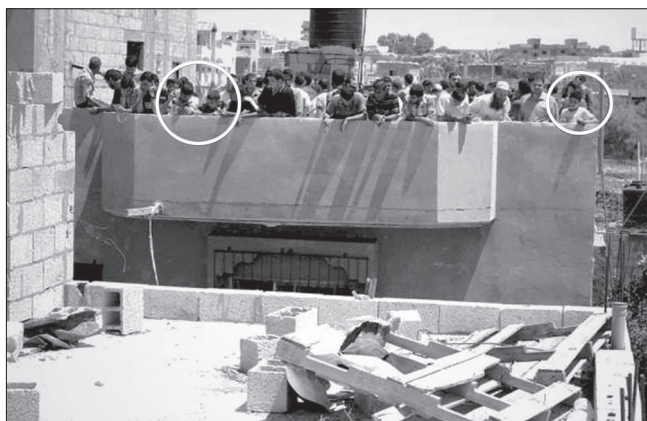
5. kép. Hamász élőpajzs háztetőn lévő gyerekekkel

A Hamász tisztában volt azzal, hogy szemtől szembe nem veheti fel a versenyt a zsidó állam haderejével. A védelemhez a városi harchoz igazodó aszimmetrikus hadviselési elemeket választotta, a támadáshoz az aszimmetrikus hadviselésre jellemző