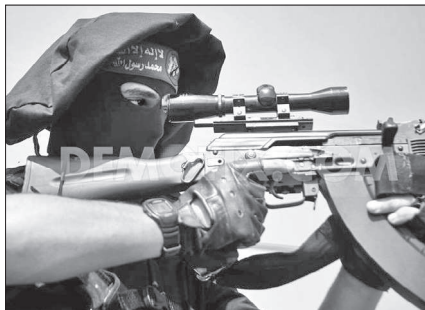
2. kép. Hamász harcos Mitznefet-el és optikai irányzókkal