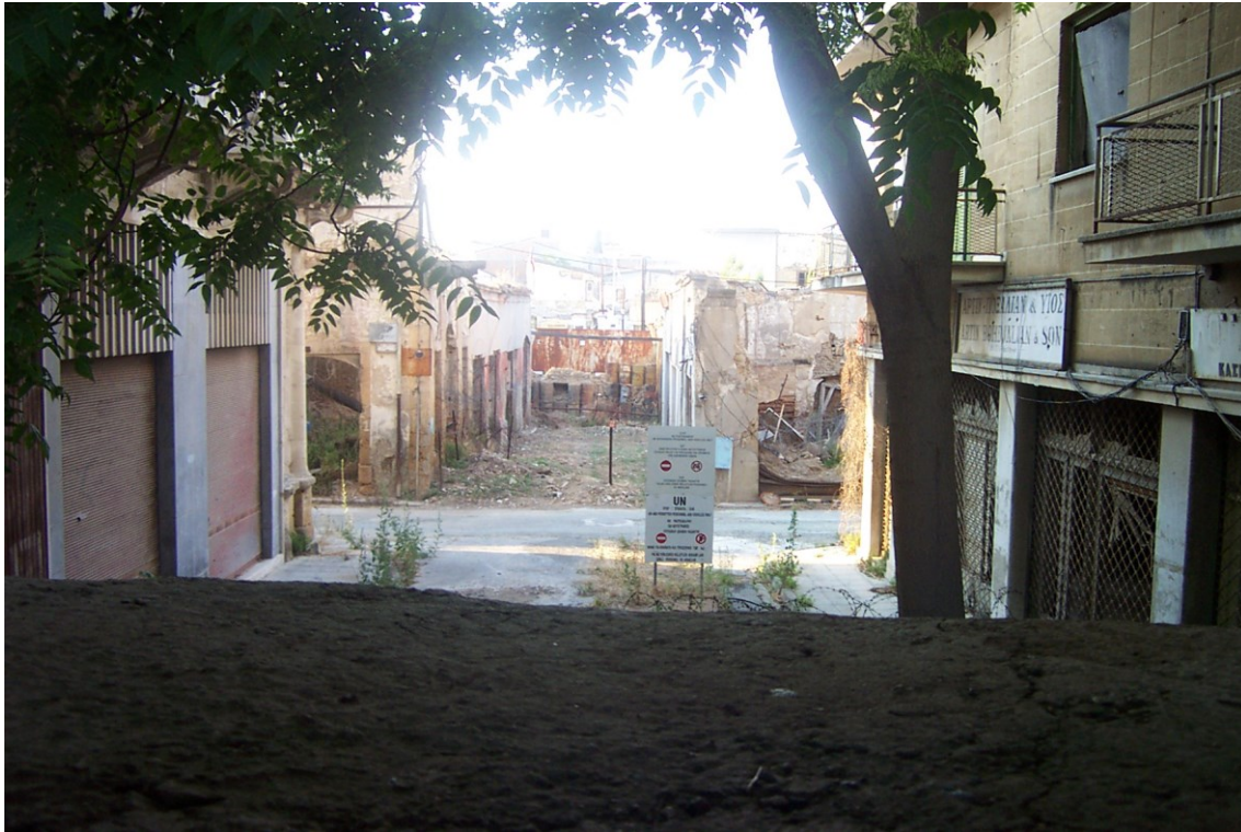
2. kép ENSZ által felügyelt terület Nicosiában egy ciprusi görög barikádról fényképezve (saját felvétel, 2003)

nyilatkozta, hogy az Európai Unió látja a megoldás elérésének esélyét, továbbá a Ciprusi Protokollban az „Aquis Communautaire” alkalmazásának tilalmát (amennyiben megállapodás születik) az északi területeken feloldják.