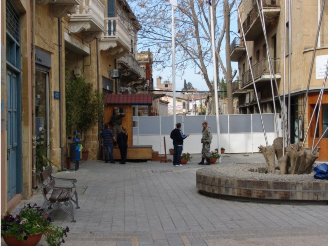
3. kép A Ledra utca Nicosiában – barikád helyett immár paraván zárja a sétálóutcát (saját felvétel, 2008)

Az EU-csatlakozástól számítva közben eltelt több mint 11 év. Előrelépés, ha történt is ilyen, nem volt szignifikáns. A politikai hozzáállások kozmetikázása az enyhe engedmények tükrében csak elodázza a végleges és kielégítő megoldás lehetőségét. Tegyük fel, hogy a tárgyalóasztalnál részt vevő felek tényleg meg akarják oldani a konfliktust, véleményem szerint a megoldás jelen pillanatban továbbra sem a két ciprusi közösség és vezetőinek a kezében van, hiszen a sorsuk a nagyhatalmak jó és rosszindulatának függvényében alakul.