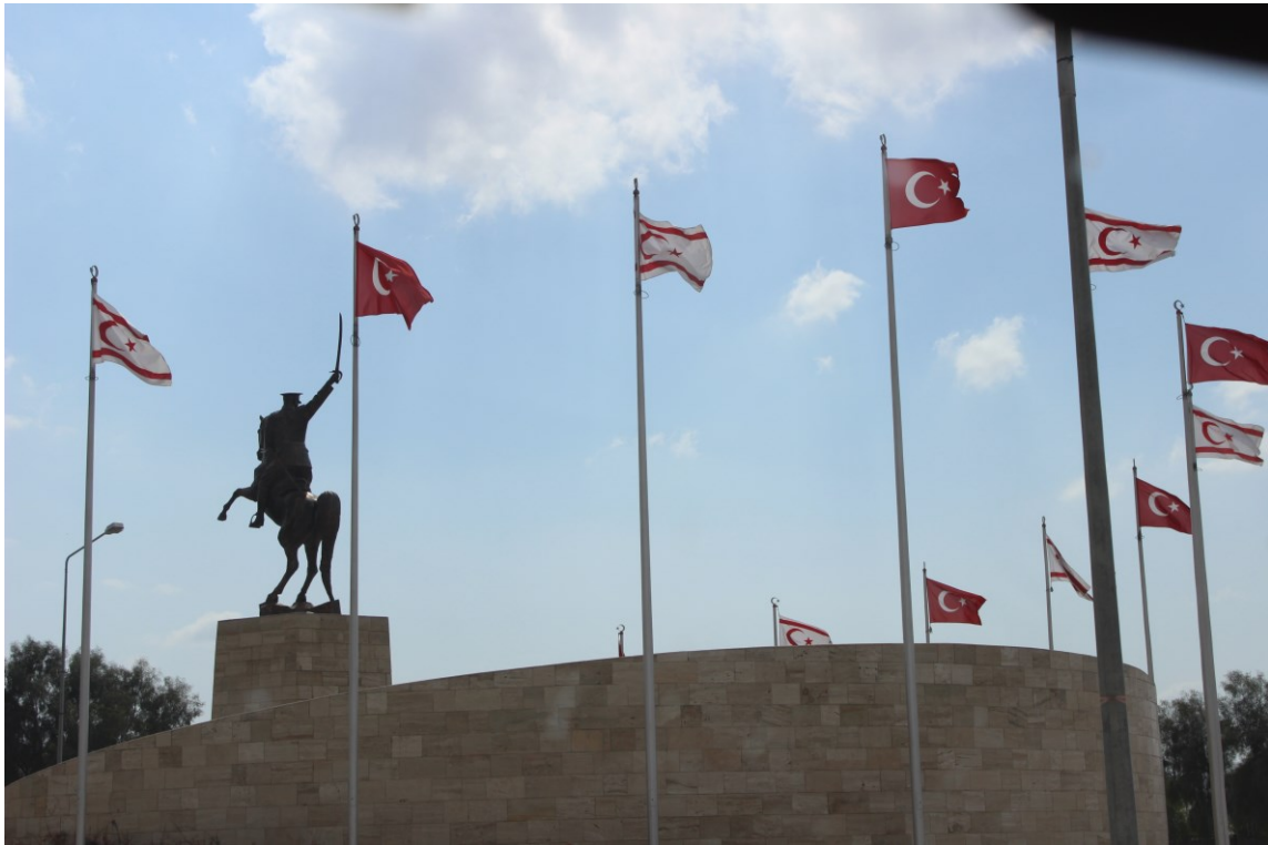
1. kép Török emlékmű a megszállt országrészben (saját felvétel, 2014)

párhuzamot vonva Belgium két nemzetén alapuló államformációja és a Ciprusi állam korábbi berendezkedése között, miszerint ha az egyik nemzet a másikat eltávolítja a közös kormányból, azt a Közösség mereven elutasítaná, vagyis ami Cipruson megtörtént, az Belgiumban nem fordulhatott volna elő. Denktas agresszív politikáját a török ciprióta közösség is nehezményezte, mert a török megszállást követően lassan kisebbségbe kerültek a betelepült törökök mellett és féltve őrzött identitásuk elvesztését látták maguk előtt. 9